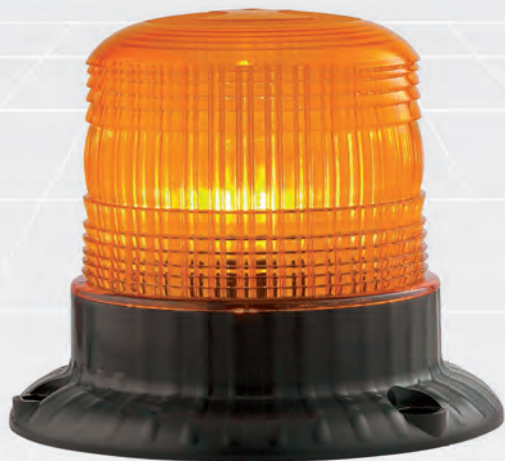
FLT LED ELEV