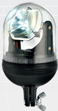
FORC S A LED FOTC S A LED ISO A (FISSAGGIO SU SPINOTTO)