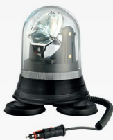
FORC S M LED FOTC S M LED (BASE A 3 MAGNETI, CAVO SPIRALATO E SPINA ACCENDISIGARI)