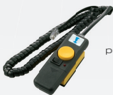
Telecomando per versioni FOTC (in dotazione)