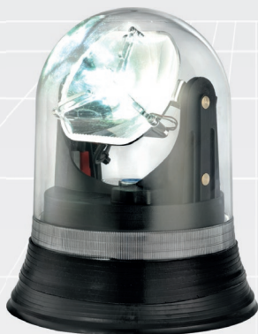
FORC S B LED FOTC S B LED ISO B1 (BASE PIANA)