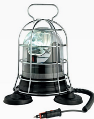
BD FORC S M LED (BASE A 3 MAGNETI, CAVO SPIRALATO, SPINA ACCENDISIGARI E GRIGLIA)